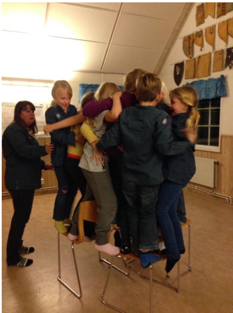
Småfåglar i samarbetsövning

Under hösten 2014 hade Småfåglarna 20 barn och 7 ledare. Terminens började med ett seglingsmöte för de scouter som gått på Småfåglarna föregående termin och som nu blivit andra-åringar. Veckan efter började terminen på riktigt med nya scouter och terminens tema var Småfåglarna i Ankeborg. Scouterna fick genomgå det vanliga programmet med knopar, följa spår, stormkök, samarbete, elda, tända fotogenlykta och mycket mer. I oktober var det övernattningscoutstugan och då hade vi även vår hemliga och spännande invigning av de nya spårarna. Ett besök på Tibblebadet gjorde vi också för att se om scouterna kunde klara simkravet på 200 meter. Terminens sista möte ägnades åt "Farmor Ankas julstök", då lussebullar bakades.